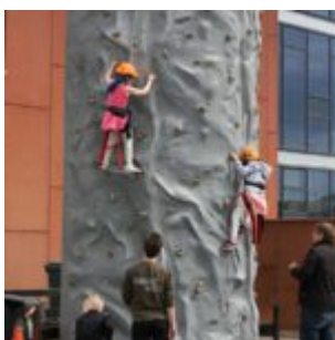
Klifurturn á Fjölskyldudegi ÍSTAKS

sumarlegar veitingar eins og grillaðar pylsur og sykurpúðar á boðstólum.