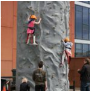
Klifurturn á Fjölskyldudegi ÍSTAKS

Ratleikir, þrautir, leiktæki, svampakast, klifurturn, hoppukastali og fjölskylduskíði voru meðal afþreyinga sem fjölskyldur tóku þátt í. Flugvélar frá Flugklúbbi Mosfellsbæjar flugu yfir svæðið og dreifðu karamellum og að sjálfsögðu voru líka sumarlegar veitingar eins og grillaðar pylsur og sykurpúðar á boðstólum.