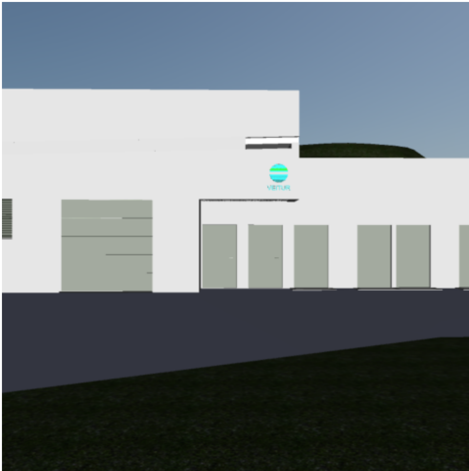
Vetrarbraut dælustöð Verk í vinnslu