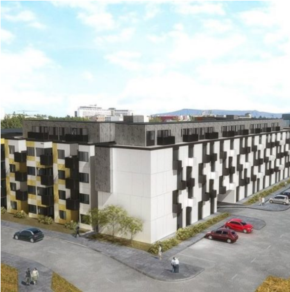
Stúdentagarðar við Sæmundargötu 21 Verk í vinnslu