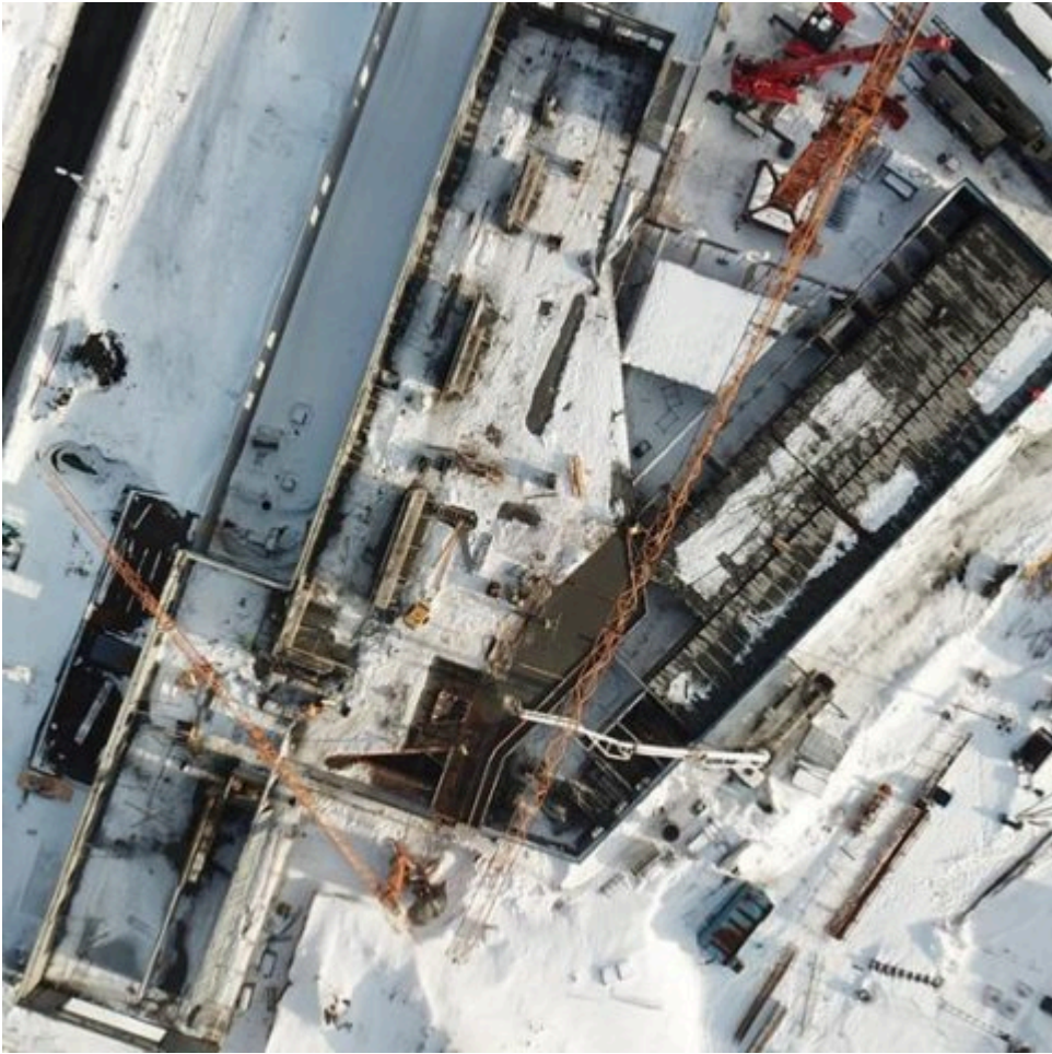
Helgafellsskóli Verk í vinnslu