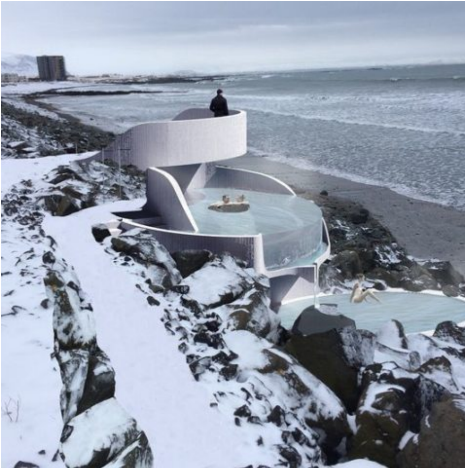
Guðlaug á Jaðarsbökkum Verk í vinnslu