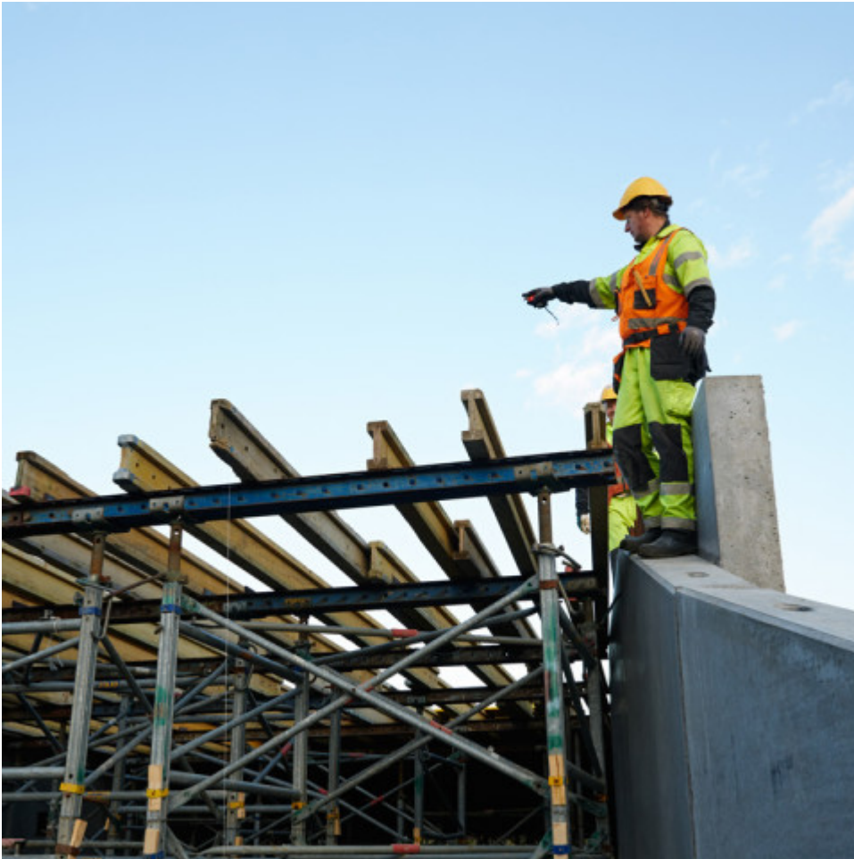
Íþróttahús við Egilshöll Verk í vinnslu